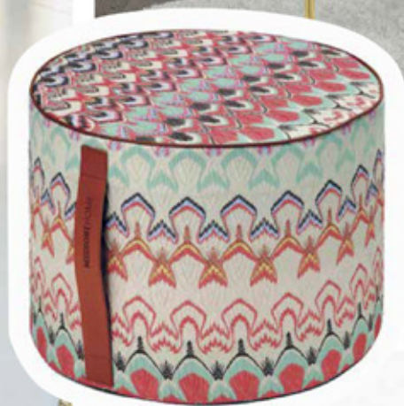
Пуф из серии Nordic Fantasy от итальянского бренда Missoni Home