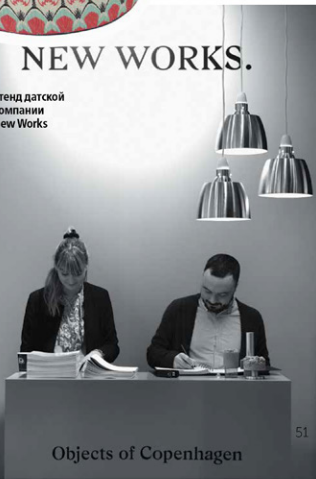
Стенд датской компании New Works

с натуральными материалами. Еще одним трендовым направлением стала геометрия в дизайне.