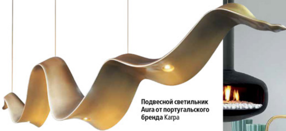
Подвесной светильник Aiga от португальского бренда Karra