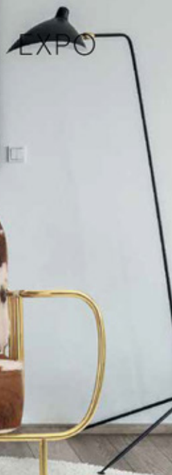
Кресло Liberty от португальской компании Bessa